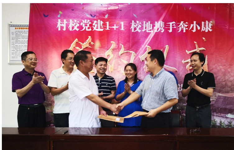
图3 十八洞村与湖南机电职业技术学院战略合作签约仪式