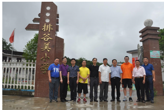
图 9 学校领导在在排谷美小学调研