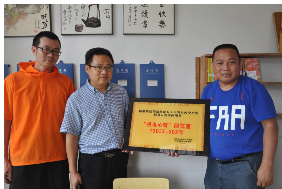
图 11 学校向排谷美小学捐赠“机电心晴”阅览室