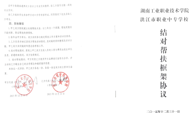
图4 湖南工业职业技术学院 洪江职业中专学校结对帮扶框架协议