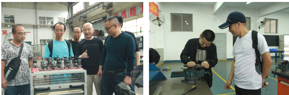
图5-图6 洪江市职业中专学校教师参观学校重点实训室、听课交流

学校在做好教育扶贫各项任务的同时，不断加强扶贫宣传和研究，在中央和省市级媒体上发表了教育扶贫外宣稿20篇，合学校扶贫工作实际，学校党委副书记牵头，相关系（院）、部门参与，组成了研究团队，立项了题为《大湘西职业教育精准扶贫路径和评价机制研究》的省级教育“十三五”规划课题1项，营造了良好的工作氛围，有力指导了各项工作的开展。